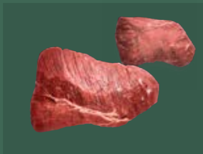
ARTIKEL: NORLAND Färsch Unterschale ohne Rolle PAD ARTIKELNUMMER: 69977143