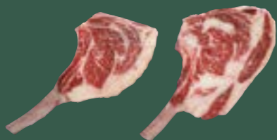
ARTIKEL: NORLAND Färse Tomahawk ARTIKELNUMMER: 69977160