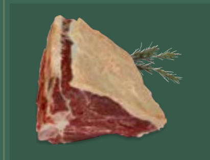
ARTIKEL: NORLAND Färsch T - Bone ARTIKELNUMMER: 69977158