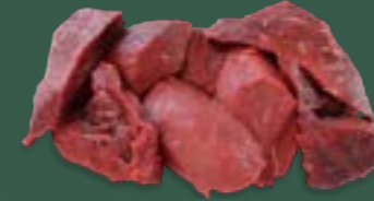
ARTIKEL: NORLAND Färse A - Fleisch ARTIKELNUMMER: 69977163