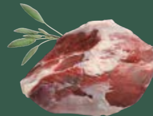
ARTIKEL: NORLAND Färse Kniekehle ARTIKELNUMMER: 69977164