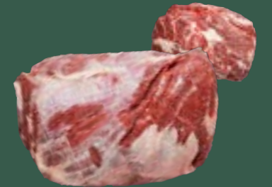
ARTIKEL: NORLAND Färse Zungenstück ARTIKELNUMMER: 69977166