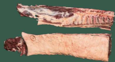
ARTIKEL: NORLAND Färse Roastbeef mit Filet ARTIKELNUMMER: 69977097