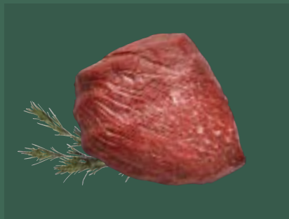
ARTIKEL: NORLAND Färsch Oberchale PAD ARTIKELNUMMER: 69977140