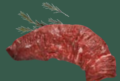
ARTIKEL: NORLAND Färse Aloyau PAD ARTIKELNUMMER: 69977172