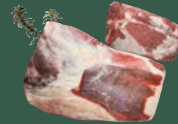
ARTIKEL: NORLAND Färse Kernbug ARTIKELNUMMER: 69977165