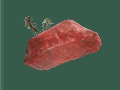
ARTIKEL: NORLAND Färsch Oberchale Babytop ARTIKELNUMMER: 69977139