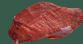
ARTIKEL: NORLAND Färse Flanksteak PAD ARTIKELNUMMER: 69977171