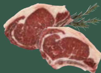
ARTIKEL: NORLAND Färse Cote de Boeuf in Scheiben ARTIKELNUMMER: 69977156