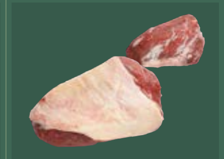
ARTIKEL: NORLAND Färsch Bürger- meisterstück ohne Spitze ARTIKELNUMMER: 69977071