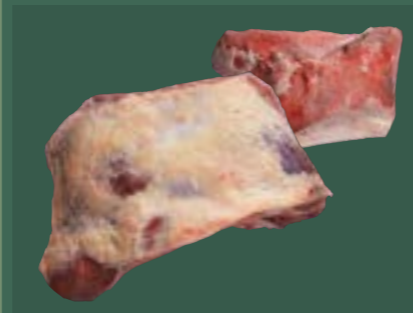
ARTIKEL: NORLAND Färsch Unterschale ohne Rolle ARTIKELNUMMER: 69977142