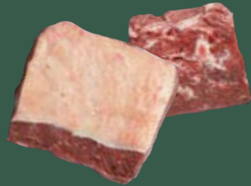
ARTIKEL: NORLAND Färse kurzes Roastbeef ARTIKELNUMMER: 69977157