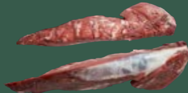
ARTIKEL: NORLAND Färse Filet ohne Kette ARTIKELNUMMER: 69977150