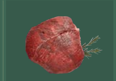
ARTIKEL: NORLAND Färsch Steakhüfte PAD ARTIKELNUMMER: 69977146