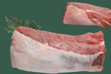
ARTIKEL: NORLAND Färse Schaufelbraten ohne Fett ARTIKELNUMMER: 69977169