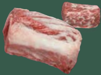
ARTIKEL: NORLAND Färse Entrecote ARTIKELNUMMER: 69977153