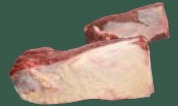
ARTIKEL: NORLAND Färse Schaufelbraten ARTIKELNUMMER: 69977168