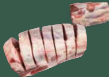
ARTIKEL: NORLAND Färse Beinrolle eingesägt ARTIKELNUMMER: 69977162