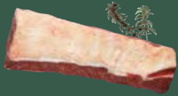
ARTIKEL: NORLAND Färse Striploin ARTIKELNUMMER: 69977151