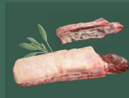
ARTIKEL: NORLAND Färsch Roastbeef SP ARTIKELNUMMER: 69977075