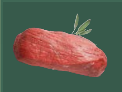
ARTIKEL: NORLAND Färsch Semerrolle PAD ARTIKELNUMMER: 69977145