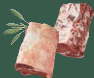
ARTIKEL: NORLAND Färse Cote de Boeuf ARTIKELNUMMER: 69977155