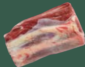
ARTIKEL: NORLAND Färse Beinrolle ARTIKELNUMMER: 69977161