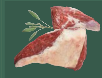
ARTIKEL: NORLAND Färsch Bürger- meisterstück mit Spitze ARTIKELNUMMER: 69977070