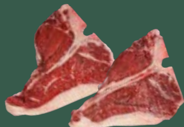
ARTIKEL: NORLAND Färse T - Bone in Scheiben ARTIKELNUMMER: 69977159