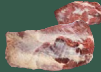
ARTIKEL: NORLAND Färse Spitzbrust ARTIKELNUMMER: 69977167