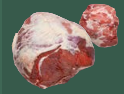
ARTIKEL: NORLAND Färsch Oberchale mit Deckel ARTIKELNUMMER: 69977137