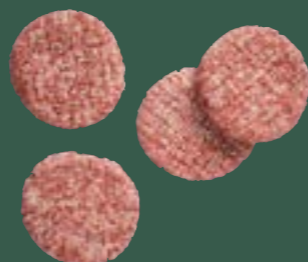
ARTIKEL: NORLAND Färse Burger ARTIKELNUMMER: 69984163