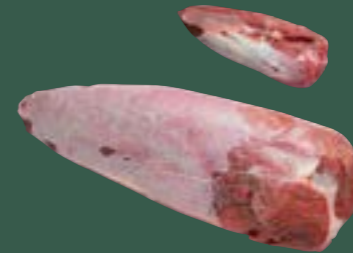
ARTIKEL: NORLAND Färse Falsches Filet ARTIKELNUMMER: 69977170