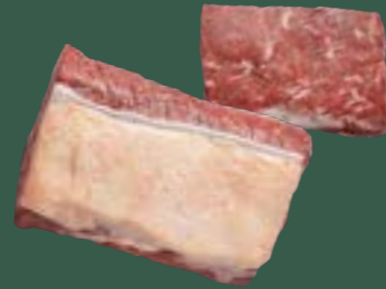
ARTIKEL: NORLAND Färse Striploin geteilt ARTIKELNUMMER: 69977152