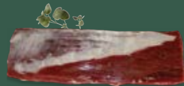
ARTIKEL: NORLAND Färse Filet Mittelstück ARTIKELNUMMER: 69977149