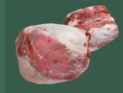
ARTIKEL: NORLAND Färsch Kugel ARTIKELNUMMER: 69977147