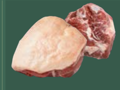
ARTIKEL: NORLAND Färsch ganze Hüfte ARTIKELNUMMER: 69977148