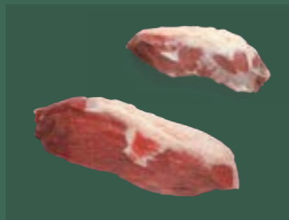
ARTIKEL: NORLAND Färsch Semerrolle ARTIKELNUMMER: 69977144