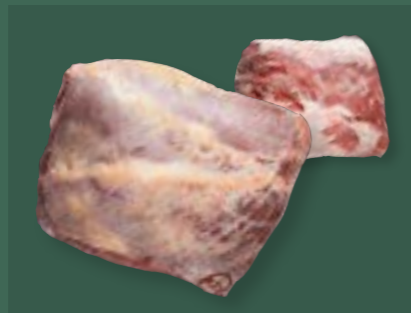
ARTIKEL: NORLAND Färsch Unterschale mit Rolle ARTIKELNUMMER: 69977141