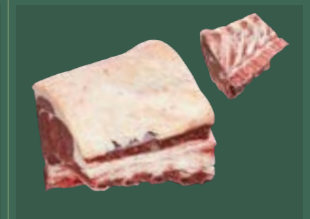
ARTIKEL: NORLAND Färsch Entrecote mit Knochen ARTIKELNUMMER: 69977154