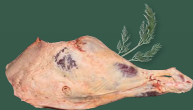
ARTIKEL: NORLAND Färse Keule ARTIKELNUMMER: 69977094