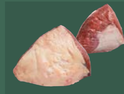
ARTIKEL: NORLAND Färsch Tafelspitz ARTIKELNUMMER: 69977069