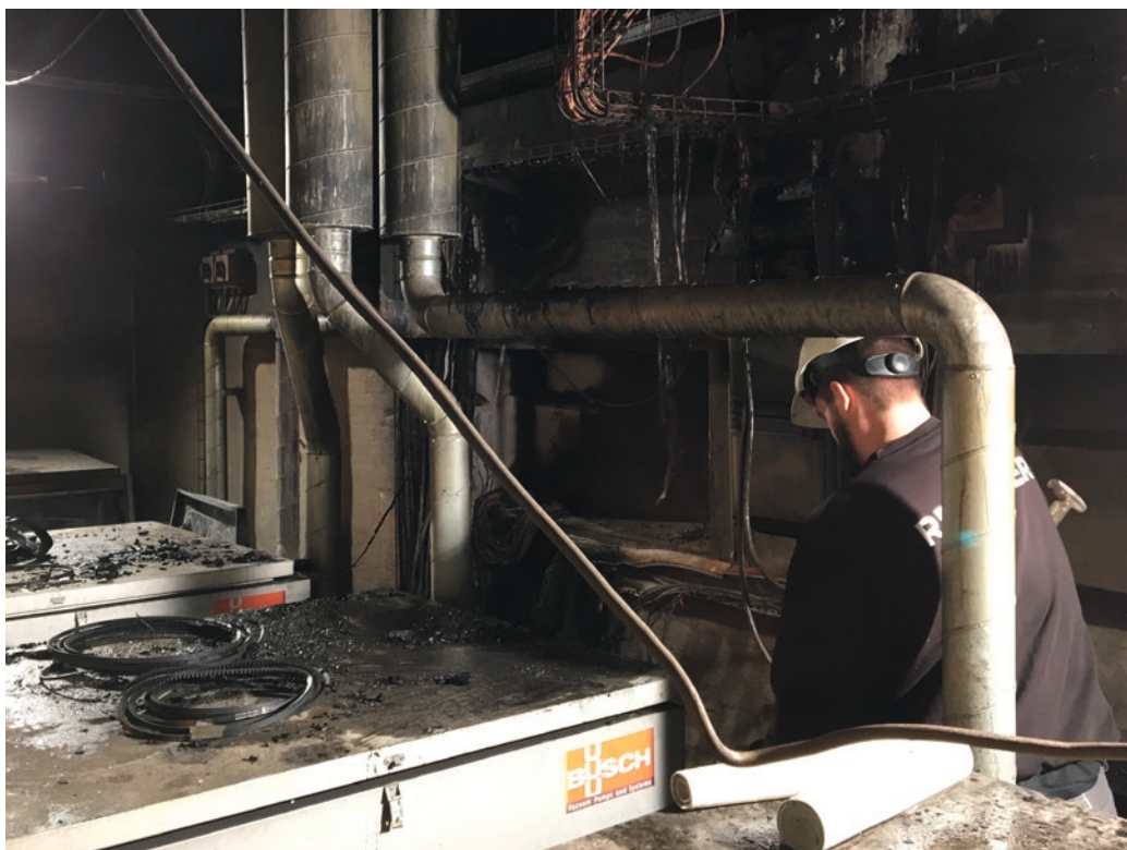
Branden startede formentlig i en vakuumpumpe og nåede at få fat i en del IT- og elinstallationer, inden brandvæsenet fik has på flammerne.

Takket være den store indsats over natten kan antallet af tabte slagtninger holdes under 5000. ■